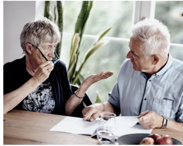
7. Gemeinsam lesen und verstehen: In der Studie des Preisträgerprojekts fanden 93 Prozent der Teilnehmenden den Patientenbrief hilfreich, die Chance auf eine gesteigerte Gesundheitskompetenz erhöhte sich um 67 Prozent.

»Eine Grundprämisse war, eine Lösung zu finden, die ohne zusätzlichen Zeitaufwand in der Klinik funktioniert.«