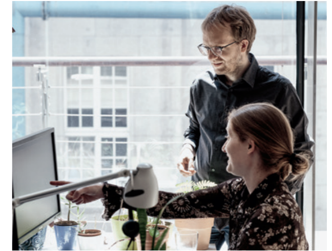
4. Jede Krankheit, jede Behandlung ist mit einem Code hinterlegt. Die Ärzt:innen von »Was hab' ich?« haben für die sog. ICD- und OPS-Codes tausende leicht verständliche Erklärungen in Form von Textbausteinen erstellt.