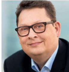
Stefan Schwartz, MdB Beauftragter der Bundesregierung für die Belange der Patientinnen und Patienten