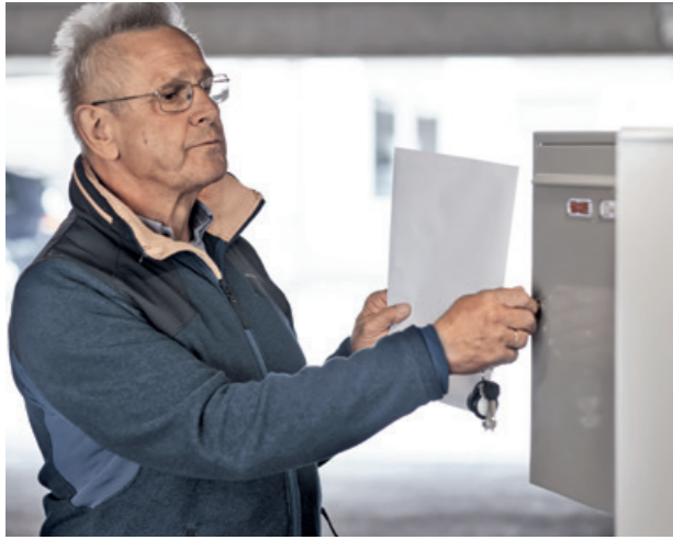
6. Mehr Wertigkeit per Post: Das Herzzentrum Dresden versendet die gedruckte Version des Patientenbriefs als ein Dokument zum Aufbewahren.