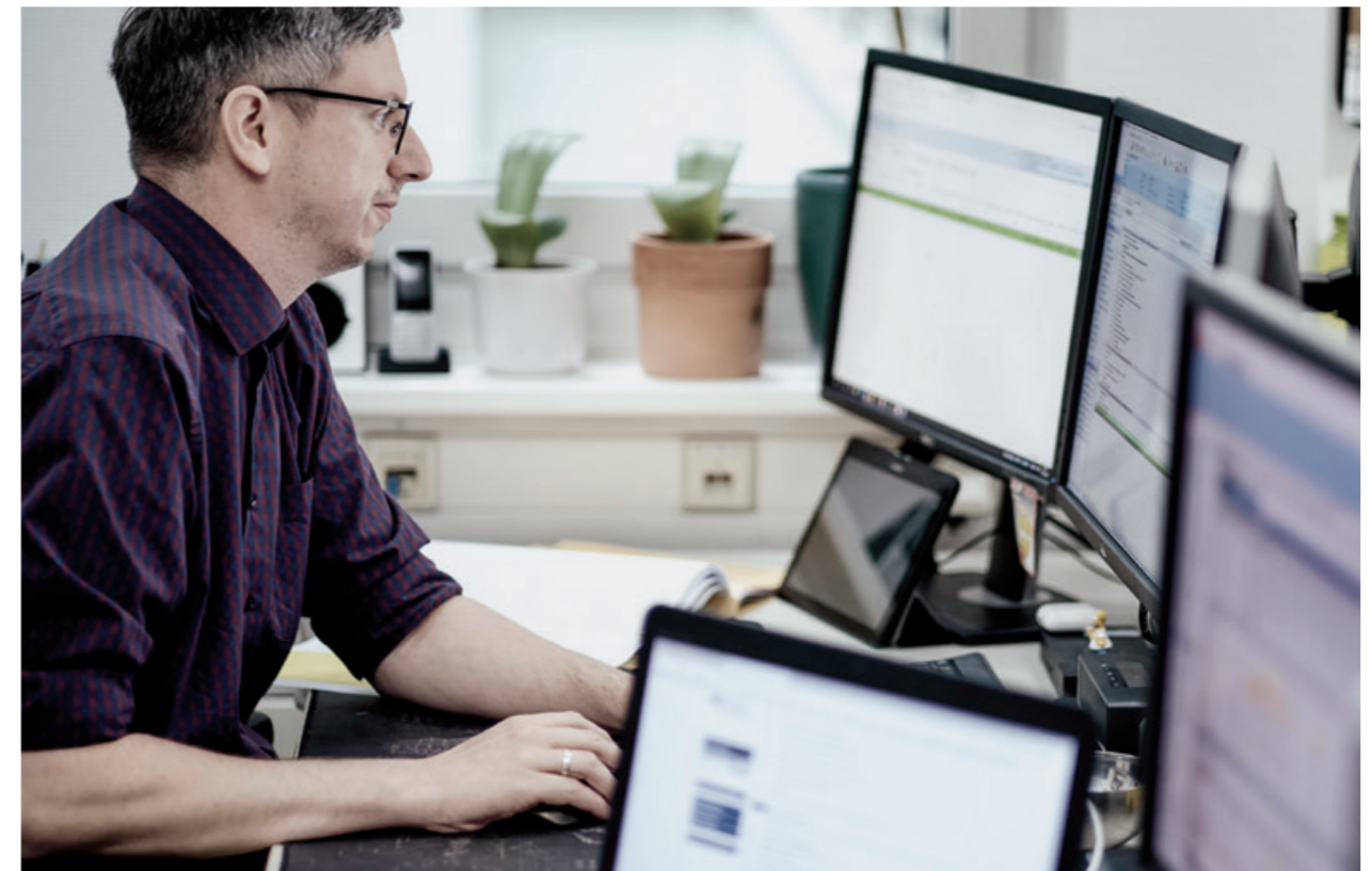
5. Die Klinik-Abläufe bleiben unverändert. Der Codierer erstellt wie gewohnt die Codes für den regulären Entlassbrief. Die Patientenbrief-Software greift auf diese Daten zu und erzeugt komplett automatisiert den leicht verständlichen Patientenbrief.