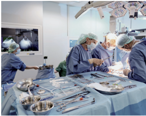
1. Eine Operation am Herzzentrum Dresden: Technik und Können arbeiten Hand-in-Hand im Einsatz für den Patienten.