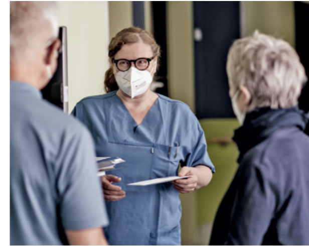
3. Der Patient erhält den »normalen« ärztlichen Entlassbrief. Trotz guten ärztlichen Gesprächs: Patient:innen benötigen nachlesbare Erläuterungen, der Arztbrief ist für sie nicht verständlich.