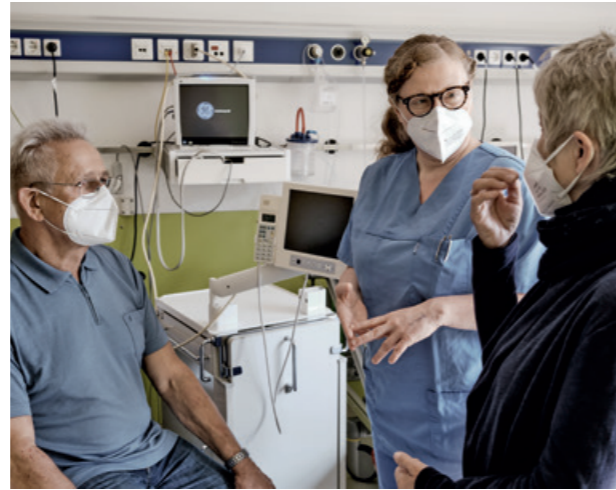
2. Ein letztes Gespräch mit der Ärztin: Dem Patienten geht es nach der OP gut – der Entlassung aus dem Krankenhaus steht nichts im Weg.